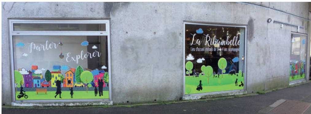
La devanture du Lieu d'Accueil Enfant-Parent (LAEP), La Ribambelle, place Nicolas Appert.

A l'issue de la rencontre, un collectif de riverains a été créé pour être associé à l'avancement du projet. L'Agent De Proximité en charge du secteur, a indiqué qu'une étude complète de la rue Victor Pengam, de mur à mur, est en cours. Une réunion regroupant les services voirie, éclairage, propreté, Eau du Ponant et autres acteurs techniques, a acté les travaux de rénovation de la rue, sans date de fin de chantier pour l'instant. Mais on peut penser que les travaux de construction de la crèche et le coup de frais dans la rue seront menés conjointement.