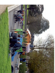
Jardin Louis Hénon