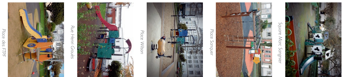
Square Marc Sangnier