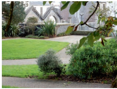
ffokalaM eur al ed uv liesnoc roval : 1 otjHP

Ces deux photos ont été prises récemment dans le centre-ville de Brest. Tentez de retrouver les lieux photographiés (réponses sur cette page).