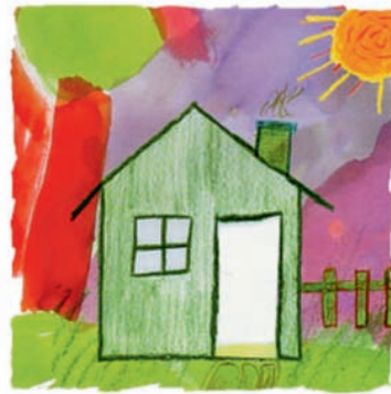
Identité graphique de la Maison Verte de Françoise Dolto

disponibilités. Il s'agit d'un accueil ponctuel qui offre 120 places pour toute la ville. Elles sont toutes accompagnées financièrement par la ville.