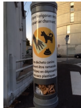
Un distributeur collaboratif de sacs à déjections animales dans le quartier Keriganon

Embellir : Annulation de la restauration de la fresque rue de Glasgow par manque de financement. La restauration de l'arbre empathique est prévue au printemps. Pas de nouvelles de notre projet d'animation pour les fêtes nautiques. Le projet participatif du square Alphonse Juin est en phase d'étude de faisabilité.