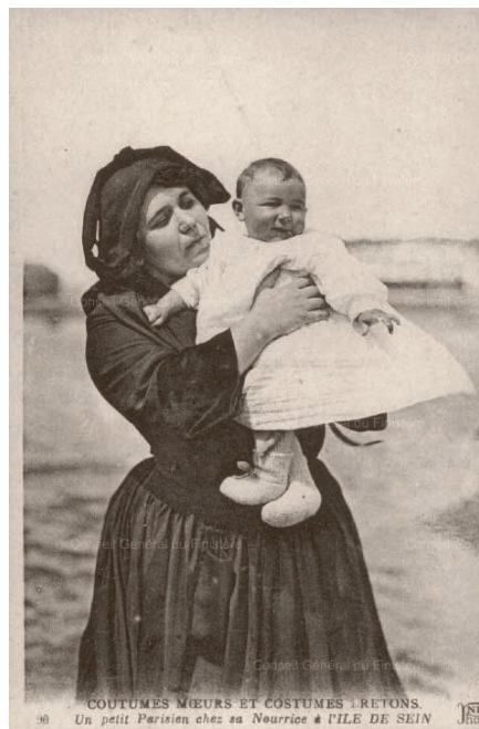
Un petit parisien dans les bras de sa nourrice à l'Île de Sein