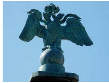
elluaG ed larengé ecalp essur tneunomM : 2 otjHP