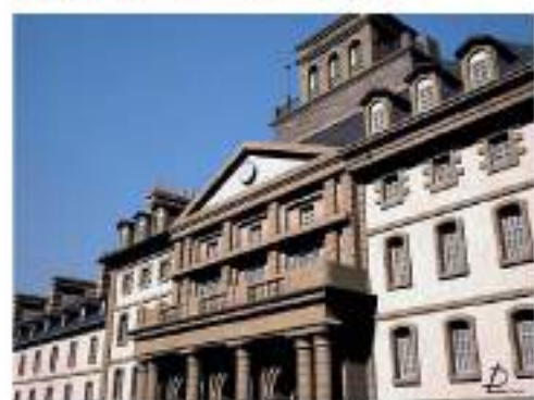
Reconstruction 3D de la caserne Fautras

Ces passionnés d'histoire brestoise reconstituent en trois dimensions (3D) des bâtiments disparus