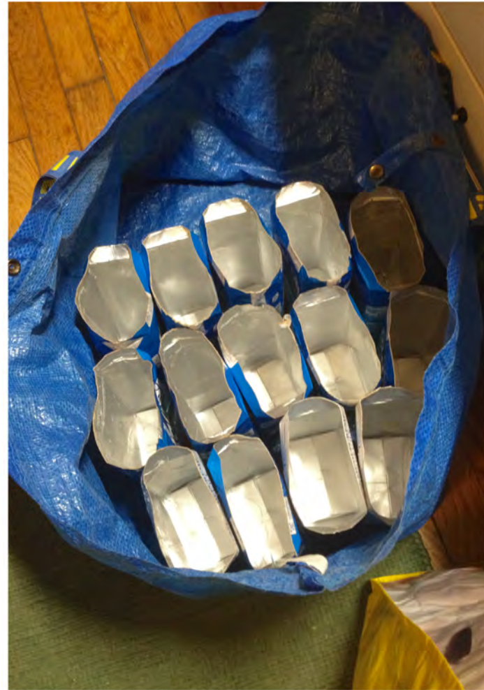
Collecte des briques de lait, découpage et rinçage (3 fois le nombre de jardinières à installer, soit 3x50 pour la station de l'Octroi) 5