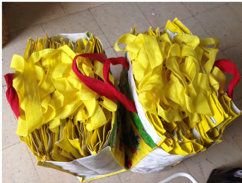
rassembler des sacs de type cabas à recycler