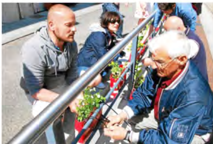
L'accrochage des jardinières au garde-corps de la station du Pilier-Rouge.

La classe de moyenne section de la maternelle du Pilier-Rouge a aussi