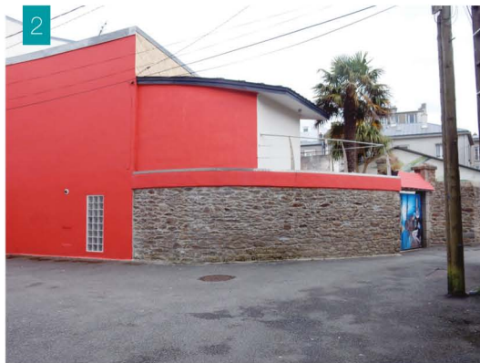
Rue capitaine de laviègne et la rue Jean Jaurès