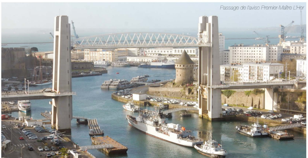
Passage de l'avisos Premier-Maitre L'Her

Pour terminer cette promenade, il est possible d'aller vers la gare en poursuivant le cours Dajot, ou de descendre vers le port par les escaliers renommés célèbres par le film « Remorques », ou encore de rejoindre la rue de Siam à travers les rues tirées au cordeau à la reconstruction. ■