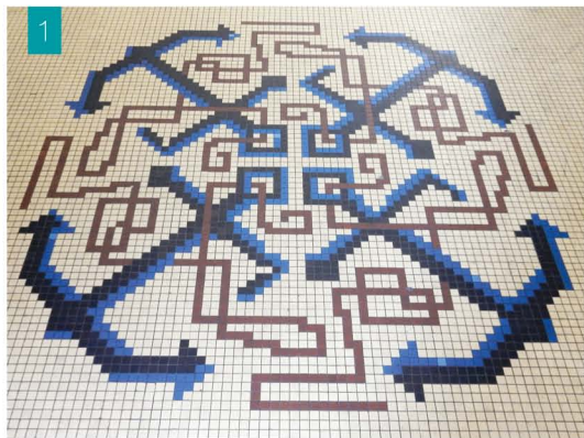
Passage entre la place Maurice Cléber

Ces deux photos ont été prises récemment dans le centre-ville de Brest. Tentez de retrouver les lieux photographiés !