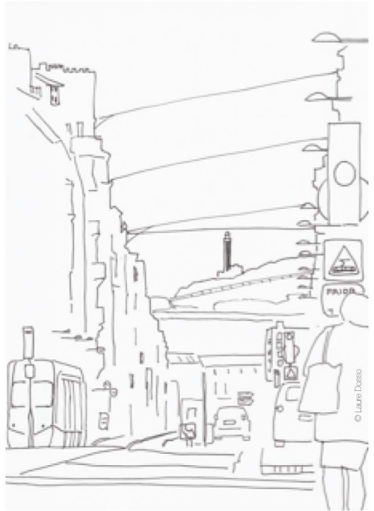
Rue Jean Jaurès, on entend les mouettes gueuler et au loin, on peut voir la mer et le phare du Portzic.

Ce repérage de proximité étant fait, il est temps de quitter Kerigonan pour aller respirer l'air du large ! Direction rue Jean Jaurès. Quel dépaysement d'entendre les mouettes gueuler en pleine ville ! La météo est clémente, le temps clair, il faut regarder tout au loin, tout en bas, l'horizon, la mer et le phare du Portzic. Bien chaussés, allons voir la grande bleue de plus près : montons dans le tram, descendons à l'arrêt Château, parcourons le jardin de l'Académie, puis un petit bout du fameux cours Dajot pour trouver le